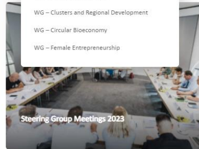
Steering Group Meetings 2023